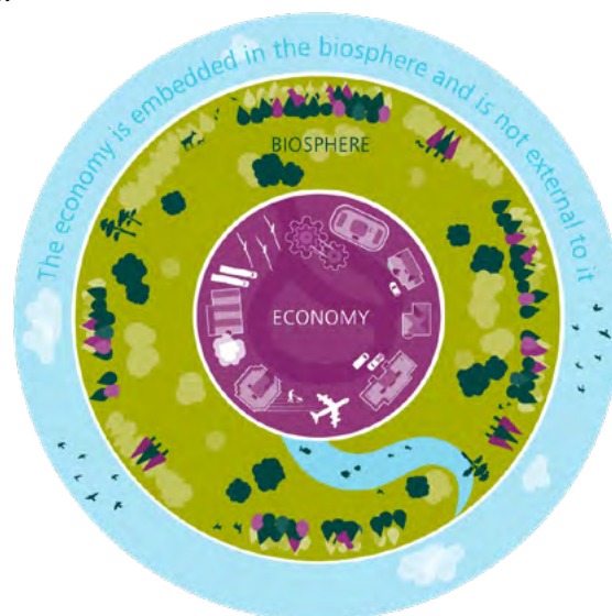
Figura 1. A economia está inserida nos seus ecossistemas vivos.

A influente Dasgupta Review, edição de 2021 , demonstrou que a economia está inserida nos seus ecossistemas vivos (figura 1). Ainda assim, muitos países continuam a aplicar abordagens convencionais que ignoram essa realidade, a pesar dos resultados decepcionantes. Lançam projetos de desenvolvimento econômico aqui e planos de restauração de ecossistemas ali de forma isolada. O trabalho permanece fragmentado e não reflete as fortes interconexões e inter-dependência entre as dimensões econômica, ambiental e social que existem no nível da paisagem local, biorregião ou território. Ao reconhecer essas interconexões, líderes podem destravar o poder de transformar esses lugares em motores de renovação que impulsionam o desenvolvimento econômico sustentável e de longo prazo.