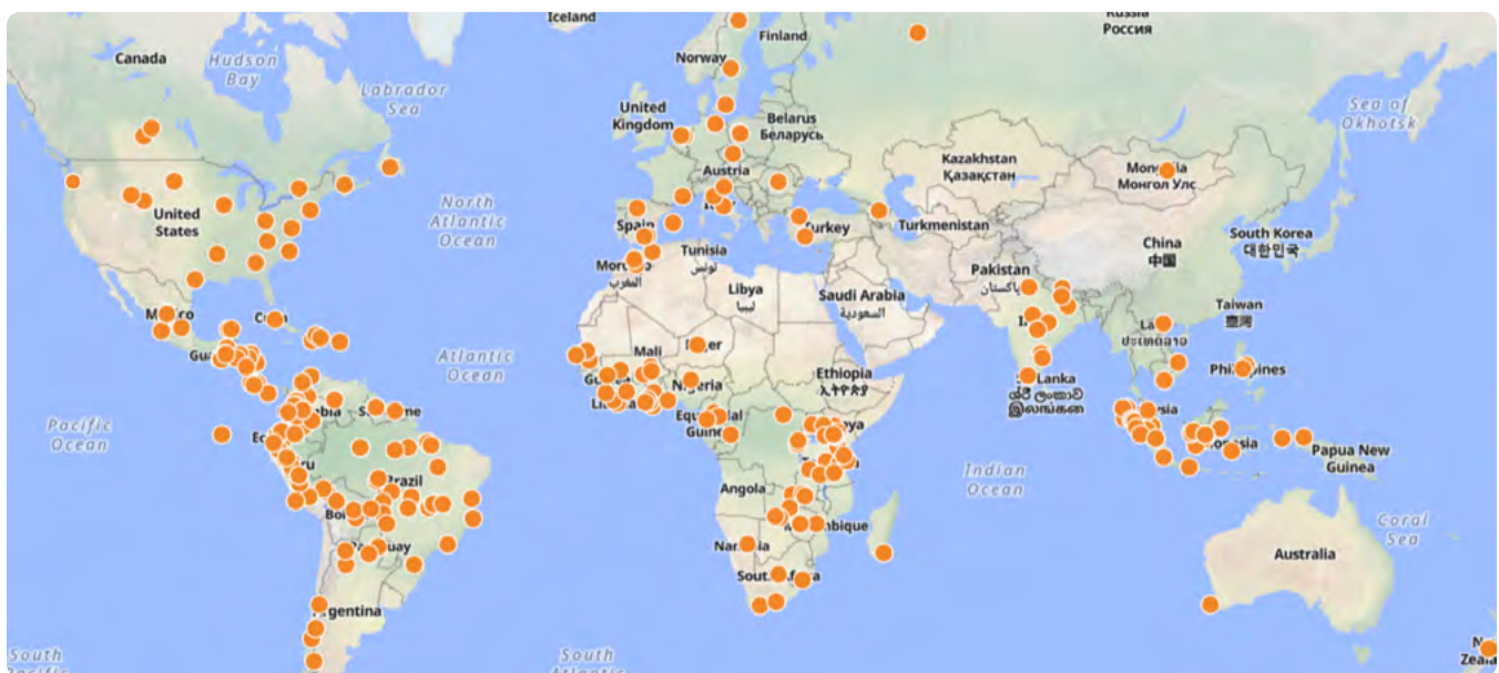
Figura 2. Alianças de paisagem que colaboram com parceiros da iniciativa 1000 Paisagens para 1 Bilhão de Pessoas, 2024